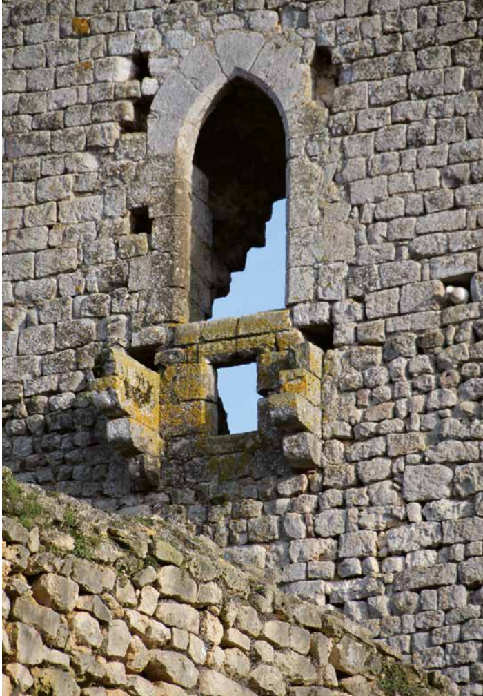
Detail van de toren.