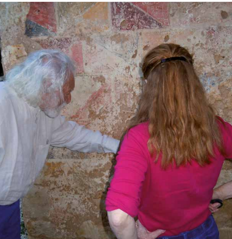
Restauratrice krijgt aanwijzing van een hoogleraar.

Van hieruit ben ik gaan restaureren. Er moesten nog een paar gaten in de toren en buitenmuren worden gedicht en er kwamen muurschilderingen met Moorse invloeden te voorschijn die inmiddels ook gerestaureerd zijn.”